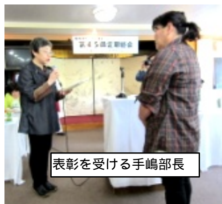
表彰を受ける手嶋部長